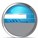
ĐỘ PHỦ CAO