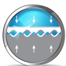
TĂNG ĐỘ BẮM DÍNH