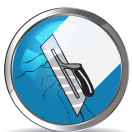
CHE LẤP CÁC VẾT NỨT