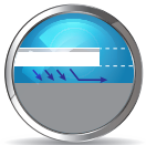
ĐỘ PHỦ CAO