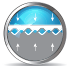
TĂNG ĐỘ BẮM DÍNH