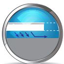
ĐỘ PHỦ CAO