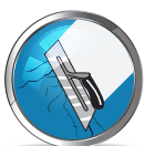
CHE LẤP CÁC VẾT NỨT