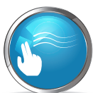
TẠO BỀ MẶT NHẼNH MỊN